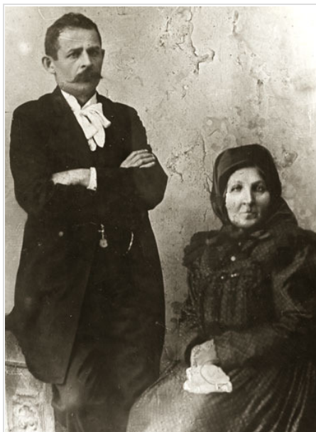
Dankó Pista édesanyjával. Édesapját kilencévesen veszítette el.

Egyes források szerint ifjabb Dankó István szülőháza a szegedi Fölsőváros cigányfertályán, a Hangász utcában (a mai Bihari utca 13. számú ház helyén) állt. Mások Szeged-Fölsőtanyát (ma: Szatymaz) említik. Keresztlevelében az 1858. június 14-i dátum szerepel. Első gyermekként született, s kilenc esztendő volt, amikor apja meghalt. A kisfiú mellett még három húga, Irén, Etel és Róza maradt félárván.