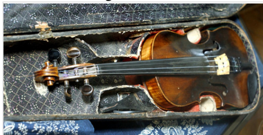
Dankó Pista hegedűje

Betegségének elhatalmasodása idején a „Pósa-asztal” társasága gyűjtést indított, s az egész ország adakozott gyógyíttatására. Egy télen át San Remóban kúrálták (onnan is lankadatlanul küldözgette haza új szerzeményeit) – a végzetes kór azonban legyőzte. A dalköltő 1903. március 29-én, sógora budai lakásában meghalt.